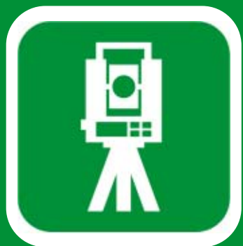
地籍測量支援システムアイコン